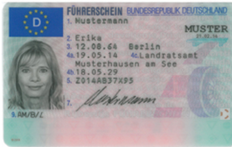
Führerschein 2013 - Vorderseite